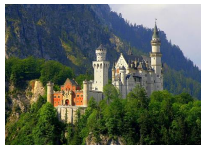
Regensburg, Munique (Estádio Olímpico), Montanha Zugspitze, Castelo Neuschwanstein, Castelo Katz acima do rio Reno

Alemanha, visitaremos o sudoeste com seus castelos no Vale Mediano do Rio Reno que é Patrimônio Mundial, a cidade de Trier com sua história dos romanos até Carlos Magno, o Vale do rio Mosela assim como a região do Palatinado (Pfalz) com Heidelberg e Speyer. Os pontos culminantes da viagem serão a degustação de vinhos no Mosteiro de Eberbach e o jantar medieval na Fortaleza de Marksburg que alcançaremos após o passeio de barco pelo rio Reno.