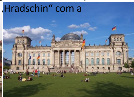
Colosseo Roma, Zugspitze, Hradshchin Praga, Parlamento Berlim, Fiorde de Geiranger Noruega

visita do castelo „Hradshchin“ com a catedral de Praga e o centro desta cidade maravilhosa. Depois de Praga continuaremos com Dresdem , a jóia do barroco, para chegar em Berlim no final do dia. Visitaremos a capital da Alemanha e continuaremos com as diferentes paisagens a bordo do navio da MSC a partir de Hamburgo. Com uma escala em Alesund chegaremos ao Cabo Norte , um dos pontos mais ao norte da Europa continental. Durante o passeio de volta a Amsterdã e Hamburgo encontraremos a paisagem fascinante dos Fiordes da Noruega .